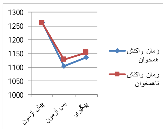
نمودار 3. مقایسه میانگین زمان واکنش (همخوان و ناهمخوان) گروه آزمایش در سه مرحله پیش آزمون، پس آزمون و پیگیری.