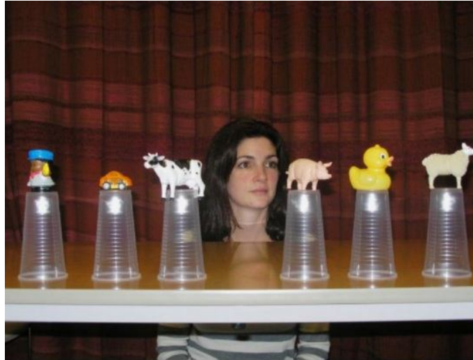
شکل 1. آزمون فرد مشاهده‌گر و محرک‌های هدف.

آزمودنی را دنبال کرده و میزان دقت آن 0/5 درجه زاویه چشم و نمونه‌گیری این دستگاه نیز 50 هرتز است. وضوح فضایی 0/2 درجه و میزان خطا 0/3 درجه است. دستگاه ردیاب چشم برای هر آزمودنی به‌طور جداگانه کالیبره می‌شود. محرک کالیبره‌کننده نقطه‌ای قرمز رنگ است که ابتدا در مرکز صفحه قرار دارد. به محض اینکه فرد به آن خیره شد با فشار دادن دکمه توسط آزمونگر در صفحه مانیتور جابه‌جا می‌شود و آزمودنی باید آن را با نگاهش دنبال کند، به محض اینکه نگاه وی روی نقطه قرمز خیره شد جای نقطه تغییر می‌کند. در مجموع، کالیبره کردن نیازمند نگاه با دقت فرد به مکان نقطه در پنج جای متفاوت روی صفحه‌نمایش است. به محض اتمام کالیبره شدن، آزمایش آغاز می‌شود.